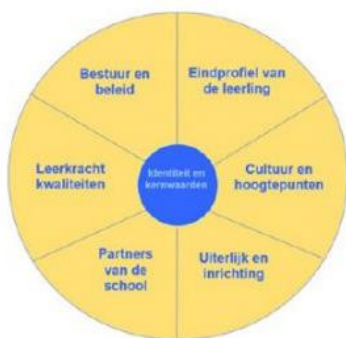
Figuur 1: Zes gebieden rond onze identiteit en kernwaarden.

De identiteitsnotitie Samen leren voor het leven is het gemeenschappelijke kader van waaruit alle SCOH-scholen werken. Op zes gebieden (zie figuur 1) zijn richtlijnen en uitspraken gedaan die geldig zijn voor alle scholen binnen de stichting. Daarnaast is er voldoende ruimte voor verdere invulling van iedere school. Op onze school geven wij de christelijke identiteit vorm door onder andere.... (denk aan vieringen, methode, dagopening, kerkbezoek, projecten etc.)